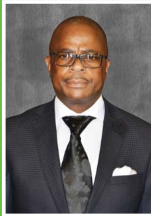
Executive Mayor Cllr Stanley Ramaila