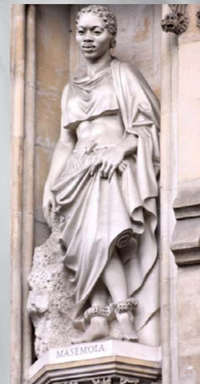
Statue of Manche Masemola at Westminster Abbey in London where similar statues of the faithful and martyrs from all parts of the world are gallantly displayed.